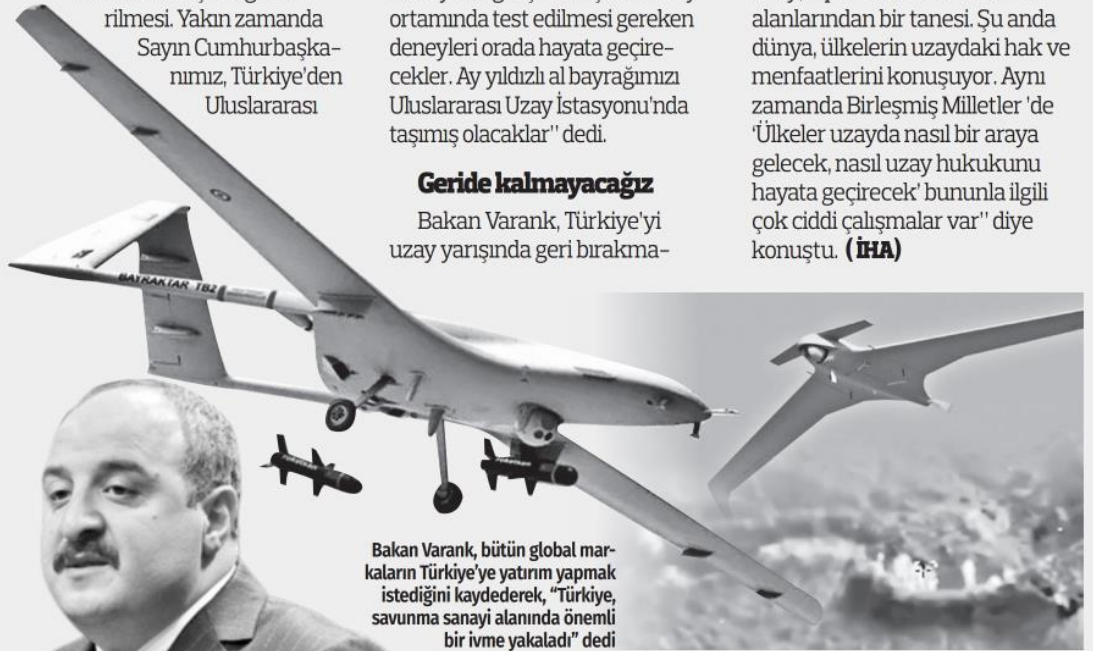
Bakan Varank, bütün global markaların Türkiye'ye yatırım yapmak istediğini kaydederek, "Türkiye, savunma sanayi alanında önemli bir ivme yakaladı" dedi

mak için ellerinden gelen gayreti gösterdiklerini ifade ederek, "Şu anda diploması başlığı altında konuşuyoruz ama baktığımızda uzay, diplomasinin en önemli alanlarından bir tanesi. Şu anda dünya, ülkelerin uzaydaki hak ve menfaatlerini konuşuyor. Aynı zamanda Birleşmiş Milletler'de 'Ülkeler uzayda nasıl bir araya gelecek, nasıl uzay hukukunu hayata geçirecek' bununla ilgili çok ciddi çalışmalar var" diye konuştu. (İHA)